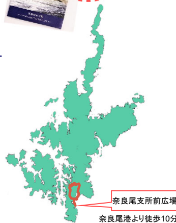
奈良尾支所前広場 奈良尾港より徒歩10分