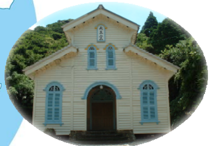
世界遺産構成資産候補 「江上天主堂」