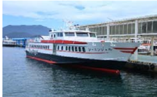
新造船 シーエンジェル