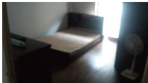
ベッドルームのひとつ